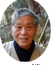
機敏な対応に感謝